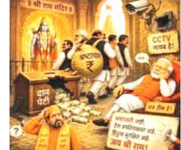
भक्तिपूर्णपंथ सर्वांना स्वच्छ माहिती असते. असल्या धोंड्याची पुजा-प्रार्थना करून, आत्मोन्मत्ती होणे शक्य नाही; आणि प्राणावर भक्तांचे मुळीच संरक्षण अगर तारण करू शकणार नाही, हे प्रत्येक हिंदूला कळते. तरीही देवळातल्या घंटा बडवायला सांज-सकाळ कोट्यवधी हिंदू का जातात? बाप, आज, पणजे गेले म्हणून जातात; का, त्यांना एखादी गुप्त जादू तेथे ओढून नेते! हिंदू लोकांची देवळांच्या देवांविषयीची भावना सरळ आणि अत्यंत प्रेमाची असती; तर हिंदुस्थानात मुसलमानां बडव्याला एकही देऊळ व देव नक्कीच बळी पडला नसता!

असे थेटपणे लिहिणारे- बोलणारे, "प्रबोधन"कार ठाकरे "देवळांचा धर्म, धर्माची देवळे"मध्ये लिहितात, "देवळातील मूर्ती म्हणजे देव नव्हे! केवळ धोंडा. भातुकलीच्या खेळातल्या बाहुलीसारखी नाही. ही प्रशासकीय उदासीनता संशयास्पद ठेवता येईल.