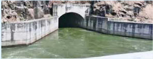
परिणामी ऐन दुष्काळीत मोठा दिलासा मिळवल्याने टेंभूच्या आवर्तनाचे कामय दुष्काळी टापात दुष्काळ सुसह्य झाला.

अखंड सुरु होती. या कालावधीत ११ टीएमसी पाणी उचलून सांगली, सातारा आणि सोलापूर जिल्ह्यातील शेतकऱ्यांना मिळवल्याने मोठा दिलासा मिळाला. जिल्ह्यात गतवर्षी दुष्काळी पट्ट्यातील तालुक्यासह इतर तालुक्यात सरासरीपेक्षा अधिक पावसाची नोंद झाली. परंतु नोव्हेंबर-डिसेंबर महिन्यापासून दुष्काळी भागासह टेंभू उपसा सिंचन योजनेच्या लाभ क्षेत्रात पाणी टंचाईची झळ सुरु झाली. त्यामुळे