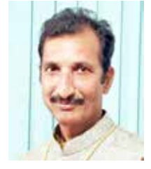
महाराष्ट्र राज्य शिवराज्याभिषेक समितीचे अध्यक्ष व संपूर्ण महाराष्ट्रातील शिवरायांच्या आठवणी पुन्हा जागृत होतात व नवीन उर्जा निर्माण होते. गडकिल्ल्यांची सुरक्षा म्हणजे शिवाजी महाराजांच्या राज्याभिषेकाच्या निमित्ताने महाराजांना खरे अभिवादन व मानवंदना ठरेल.कारण शिवरायांनी मुठभर मावळ्यांच्या साक्षीने हिंदवी स्वराज्याची स्थापना केली व संपूर्ण किल्ले काबीज केले हा अभिमान महाराष्ट्रासह संपूर्ण भारताला आहे.त्यामुळे इतिहास जागृत ठेवण्यासाठी संपूर्ण किल्ले पर्यटनाच्या दृष्टीने व शिवरायांची आठवण या उद्देशाने किल्ल्यांची जोपासना करणे गरजेचे आहे.कारण शिवाजी महाराज रयतेचे राजा होतेच.परंतु त्यांच्यात दैवी शक्ती सुद्धा होती.आजही कुठल्याही गडकिल्ल्यांवर गेले तर ४ हजार फूट उंचीवर भर उन्हाळ्यात आपल्याला किल्ल्यावर स्वच्छ पाणी प्यायला मिळते.हा संपूर्ण शिवरायांचाच प्रताप आहे.असे सांगण्यात येते की वयाच्या १७ व्या वर्षी शिवरायांनी स्वतः डिझाईन करून रायगड किल्ला बांधल्याचे सांगण्यात येते.आई जगदंबेच्या आशीर्वादाने शिवाजी महाराजांनी आपले संपूर्ण काम फत्ते केले व मावळ्यांमध्ये उर्जा निर्माण करून मोगलांना भुईसपाट केले. अवझल खानासारख्या महाकाय शक्तीशाली सरदाराला गनीमीकाव्याने यमलोक पोहचविले.अशाप्रकारे मोगलांच्या संपूर्ण सरदारांना एक-एक करून यमलोक मोगलांच्याच काम शिवरायांनी, त्यांच्या सरदारांनी आणि मावळ्यांनी केले. हा देश साधु संतांचा, थोर महात्म्यांचा, क्रांतीकारकांचा व हिंदवी स्वराज्याची स्थापना करणाऱ्या शिवरायांचा देश आहे.याची जोपासना महाराष्ट्र व केंद्र सरकारने करावी अशी मी आग्रहाची विनंती करतो.देशात वाढते अत्याचार

गडकिल्ल्यामुळेच शिवरायांच्या आठवणी पुन्हा-पुन्हा जागृत होतात व नवीन उर्जा निर्माण होते. गडकिल्ल्यांची सुरक्षा म्हणजे शिवाजी महाराजांच्या राज्याभिषेकाच्या निमित्ताने महाराजांना खरे अभिवादन व मानवंदना ठरेल.कारण शिवरायांनी मुठभर मावळ्यांच्या साक्षीने हिंदवी स्वराज्याची स्थापना केली व संपूर्ण किल्ले काबीज केले हा अभिमान महाराष्ट्रासह संपूर्ण भारताला आहे.त्यामुळे इतिहास जागृत ठेवण्यासाठी संपूर्ण किल्ले पर्यटनाच्या दृष्टीने व शिवरायांची आठवण या उद्देशाने किल्ल्यांची जोपासना करणे गरजेचे आहे.कारण शिवाजी महाराज रयतेचे राजा होतेच.परंतु त्यांच्यात दैवी शक्ती सुद्धा होती.आजही कुठल्याही गडकिल्ल्यांवर गेले तर ४ हजार फूट उंचीवर भर उन्हाळ्यात आपल्याला किल्ल्यावर स्वच्छ पाणी प्यायला मिळते.हा संपूर्ण शिवरायांचाच प्रताप आहे.असे सांगण्यात येते की वयाच्या १७ व्या वर्षी शिवरायांनी स्वतः डिझाईन करून रायगड किल्ला बांधल्याचे सांगण्यात येते.आई जगदंबेच्या आशीर्वादाने शिवाजी महाराजांनी आपले संपूर्ण काम फत्ते केले व मावळ्यांमध्ये उर्जा निर्माण करून मोगलांना भुईसपाट केले. अवझल खानासारख्या महाकाय शक्तीशाली सरदाराला गनीमीकाव्याने यमलोक पोहचविले.अशाप्रकारे मोगलांच्या संपूर्ण सरदारांना एक-एक करून यमलोक मोगलांच्याच काम शिवरायांनी, त्यांच्या सरदारांनी आणि मावळ्यांनी केले. हा देश साधु संतांचा, थोर महात्म्यांचा, क्रांतीकारकांचा व हिंदवी स्वराज्याची स्थापना करणाऱ्या शिवरायांचा देश आहे.याची जोपासना महाराष्ट्र व केंद्र सरकारने करावी अशी मी आग्रहाची विनंती करतो.देशात वाढते अत्याचार