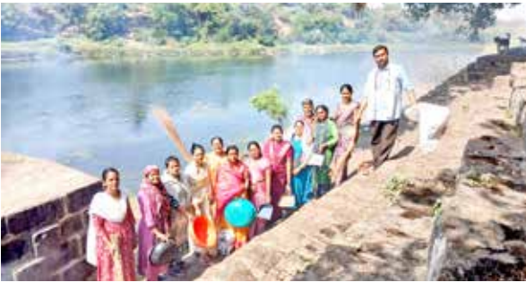
यावेळी केंद्रातील सेवेकरी परिवारातील महिला व पुरुष सेवेकऱ्यांनी उत्स्फूर्त सहभाग घेत नदी परिसराची स्वच्छता केली. नदी

अकलुज (कट्टसत्य वृत्त): - नदी स्वच्छता व जल संवर्धन अभियान २०२६ अंतर्गत नदी हीच माता, तीच आपली जीवनदाता ! आहे त्यामुळे अखिल भारतीय श्री स्वामी समर्थ सेवा व आध्यात्मिक विकास मार्ग (दिंडोरी प्रणित) श्री स्वामी समर्थ केंद्र अकलुज व माळीनगर (जि. सोलापूर) यांच्या वतीने पर्यावरण प्रकृती विभागाच्या वतीने गंगा दशहरा सप्ताह निमित्त नीरा नरसिंहपूर येथील संगमावरील नीरा-भीमा नदी किनारी स्वच्छता अभियान राबविण्यात आले होते.