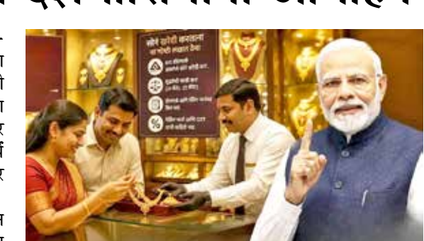
नरेंद्र मोदींची देशवासियांना आवाहनं

नवी दिल्ली (वृत्त सेवा): - पश्चिम आशियातील संकटाच्या पार्श्वभूमीवर पंतप्रधान नरेंद्र मोदी यांनी देशवासियांना पुन्हा एकदा आवाहन केले आहे. खाद्यतेलावर परकीय चलन जास्त प्रमाणात खर्च होतं. त्यामुळे त्याचा कमी वापर करावा. तसेच शक्य तिथे ऑनलाईन मिटिंग घ्याव्यात, शाळांनी ऑनलाईन क्लासेस घ्यावेत असं आवाहनही मोदींनी केले. गुजरातमधील एका कार्यक्रमात पंतप्रधान मोदींनी देशवासियांना ही आवाहनं केली आहेत.