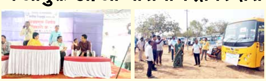
शासकीय तंत्रनिकेतन या ठिकाणी उभाण्यात आलेल्या मतदान यंत्र (ईव्हीएम) वितरण केंद्रांना भेट देण्यात आली. यावेळी स्ट्रॉंगरूम, निवडणूक साहित्य वितरण प्रक्रिया तसेच सुरक्षाव्यवस्थेची तपासणी करण्यात आली. मतदान प्रक्रिया पारदर्शक, सुरक्षित आणि शांततेत पार पडावी यासाठी करण्यात आलेल्या नियोजनाबाबत संबंधित अधिकार्यांकडून सविस्तर माहिती घेण्यात आली. उद्या होणाऱ्या मतदानासाठी आज शहरातील सर्व सात निवडणूक निर्णय अधिकारी (पान 2 वर..)