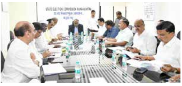
मतदान नक्की करा 'महानगरपालिकांच्या निवडणुकांमध्ये मोठ्या संख्येने मतदान करून आपणही आपल्या शहराच्या- महानगराच्या जडणघडणीत योगदान द्यावे आणि लोकशाही प्रक्रियेत सक्रीय सहभाग नोंदवावा. आपलं मत आपल्या शहराचं भवितव्य ठरवू शकतं. कारण ते अन्मोल आहे. लोकशाहीतला तो आपला महत्त्वाचा हक्क आहे आणि तो आपण मतदानाच्या माध्यमातून बजावायला हवा, त्यासाठी आपण नक्की मतदान करावे, असे मतदारांना आवाहारे केले आहे.'

मुंबई, (कटुसत्य वृत्त):- राज्यातील 29 महानगरपालिकेच्या सार्वत्रिक निवडणुकांसाठी गुरुवारी मतदान होत असून त्यासाठी सर्व यंत्रणा सज्ज झाली आहे. 2 हजार 869 जागांसाठी ही निवडणूक होत असून 3 कोटी 48 लाख 79 हजार 337 मतदारांकरिता 39 हजार 92 मतदान केंद्रांची व्यवस्था करण्यात आली आहे. निवडणूक रििंगणात 15 हजार 908 उमेदवार आहेत; तसेच पुरेशा पोलीस बंदोबस्ताचीदेखील व्यवस्था करण्यात आली आहे.