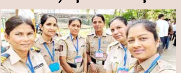
झाला. निवडणुकीसाठी सोलापूर शहर व बाहेरील अधिकारी, अंमलदार असा एकूण साडेतीन हजार पोलिसांचा बंदोबस्त नेमला आहे. ४८ तासांचा हा बंदोबस्त मतदान पेट्या गोदामात जमा

सोलापूर (कटुसत्य वृत्त):- महापालिकेसाठी गुरुवारी सकाळी साडेसात ते सायंकाळी साडेपाच वाजेपर्यंत मतदान होणार आहे. या पार्श्वभूमीवर बुधवारी सोलापूर शहरातील एक हजार ९१ बुधवार मतदान पेट्या वितरित करण्यात आल्या आहेत. त्यासोबत पोलिसांचा बंदोबस्ताही प्रत्येक बूथवर दाखल