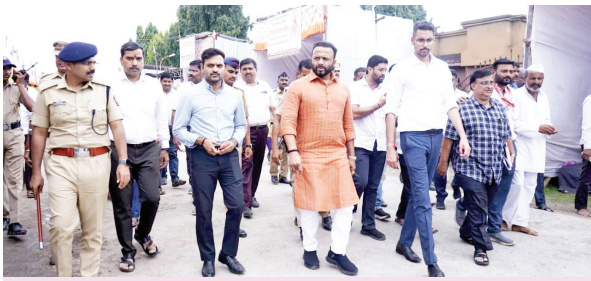
पालकमंत्री जयकुमार गोरे यांनी केली दर्शन रांग व पत्रा शोड येथील पाहणी

पंढरपूर (कट्टसत्य वृत्त): - श्री विठ्ठल रुक्मिणी मातेच्या दर्शनासाठी आषाढी, कार्तिकी, चैत्री व माघी या प्रमुख यात्रांसह एकादशी दिवशी लाखो भाविक तसेच दररोज हजारो भाविक पंढरपूरला येतात. विठ्ठलाच्या दर्शनाची आस घेऊन येणाऱ्या लाखो भाविकांना विठ्ठलाच्या दर्शनासोबत चंद्रभागेचे स्नान केल्याशिवाय वारी पूर्ण केल्याचे समाधान मिळत नसते त्यामुळे वारकरी संप्रदायात विठ्ठल रुक्मिणी दर्शना एवढेच चंद्रभागेच्या पवित्र स्नानाला महत्त्व असल्याने चंद्रभागा वाळवंट व मंदिर परिसर कायम स्वच्छ राहिल याची दक्षता घ्यावी अशा सूचना, ग्रामविकास व पंचायतराज मंत्री तथा पालकमंत्री जयकुमार गोरे यांनी दिल्या.