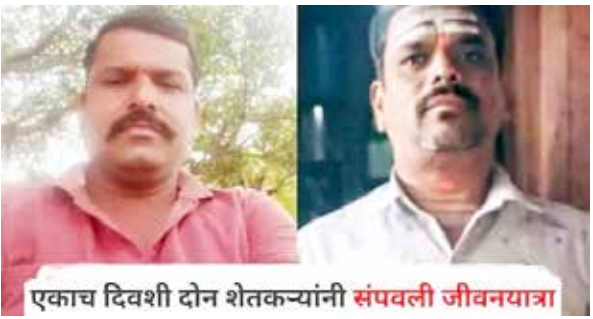
एकाच दिवशी दोन शेतकऱ्यांनी संपवली जीवनयात्रा

सोलापूर (कटूसत्य वृत्त): मुसळधार पावसाने सोलापूर जिल्ह्याला अक्षरशः झोडपून काढलं आहे. नद्या-नाले, तलाव तुडुंब भरून वाहत आहेत. शेकडो गावे जलमय झाली असून हजारो नागरिकांना सुरक्षितस्थळी स्थलांतरित करण्यात आलं आहे. शेतीपिकांचेही प्रचंड नुकसान झाले आहे. या नैसर्गिक आपत्तीच्या छायेतूनच बार्शी तालुक्यातील दोन गावांमध्ये एकाच दिवशी दोन शेतकऱ्यांच्या आत्महत्या केल्याच्या धक्कादायक घटना समोर आल्या असून, संपूर्ण तालुक्यावर शोककळा पसरली आहे.