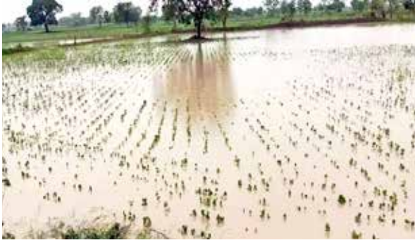
अनेक तालुक्यांमध्ये सीना व भीमा नदीला आलेल्या पुरामुळे शेकडो कुटुंबांचे घरदार उध्वस्त झाले.

सोलापूर (सचिन जाधव):- सोलापूर जिल्ह्यातील अनेक भागांमध्ये आलेल्या महापुराचे पाणी आता हळूहळू ओसरू लागले आहे. गेल्या काही दिवसांपासून कोसळलेल्या अचिरत पावसानंतर शुक्रवारी काही ठिकाणी ऊन दिसल्याने नागरिकांना दिलासा मिळाला. मात्र, नुकसानीचे विदारक चित्र उघड होत असून संसार उभा करण्यासाठी नागरिकांना पुन्हा कष्ट करणे लागत आहेत. करमाळा, माढा, मोहोळ, उत्तर सोलापूर व दक्षिण सोलापूरसह