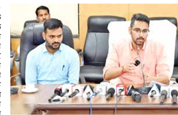
आशीर्वाद यांनी केले आहे. जिल्हातील नुकसानग्रस्त व पुरग्रस्तांच्या सार्वजनिक हितासाठी नागरिकांना आवश्यक त्या सुविधा उपलब्ध व्हाव्यात या उद्देशाने मदत कक्ष स्थापन करण्यात आलेला असून, मदत कक्षामार्फत आवश्यक ती मदत करून बाधित नागरिकांचे प्रश्न तात्काळ कार्यवाहीसाठी संबंधित विभागांशी संपर्क साधून पुरस्काराने गौरव होणार आहे.

सोलापूर, (कटुसत्य वृत्त):- सोलापूर जिल्ह्यात अतिवृष्टीमुळे नुकसानग्रस्त व पूर परिस्थितीमुळे पुरग्रस्त नागरिकांना आवश्यक ती मदत करण्यासाठी जिल्हा प्रशासन जिल्हाधिकारी कार्यालय सोलापूर यांचे वतीने जिल्हाधिकारी कार्यालय सोलापूर, सात रस्ता, शासकीय दुध डेअरी शेजारी सोलापूर येथे नैसर्गिक आपत्ती मदत कक्ष स्थापन करण्यात आले आहे. तर तालुक्याच्या ठिकाणी तालुकास्तरीय मदत कक्षाची स्थापना करण्यात आलेली असून ज्या दानशूर व्यक्ती, संस्था, संघटना यांना पुरग्रस्त बाधितांना मदत करावयाची आहे त्यांनी जिल्हास्तरीय व तालुकास्तरीय मदत कक्षाशी संपर्क करावा, असे आवाहन जिल्हाधिकारी कुमार