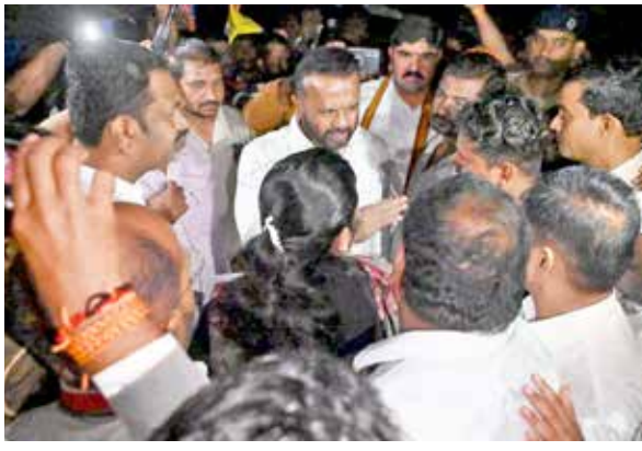
एवढे कुटुंबीयांना आवश्यक ती मदत करण्यात येईल. महिम येथे अरुंद पूल असून पुलाच्या रुंदीकरणे काम संबंधित विभागाने तात्काळ करावे. कडलास येथे दगडफुटी झाल्याने