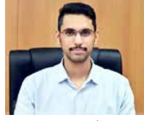
संभाव्य बांधितांसोबत बैठका घेऊन त्यांची मते आणि अपेक्षा जाणून घेण्यात आल्या आहेत. पहिल्या टप्प्यात, ज्या नागरिकांनी संमती दिली आहे, त्यांची जागा संपादित केली जाईल. त्यामुळे सक्तीने भूसंपादन करण्याचा प्रशासनाचा कोणताही विचार नाही, असे जिल्हाधिकार्यांनी स्पष्ट केले. मात्र, काही ठिकाणी विरोध झाल्यास, कायद्यातील तरतुदीनुसार तीन महिन्यांनंतर सक्तीने भूसंपादन करण्याचा पर्याय खुला ठेवण्यात आला आहे.