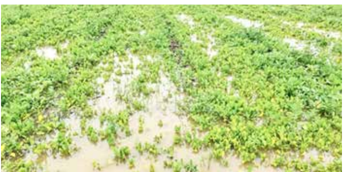
सोलापुरात आठवडाभरापासून सुरू असलेल्या मुसळधार पावसाने जिल्ह्याच्या अनेक भागात धुमाकूळ घातला आहे. पावसामुळे मोहोळ, उत्तर सोलापूर, दक्षिण सोलापूर, बाशी तालुक्यातील बक्षी अनेक भागात सर्वत्र पाणी आले आहे. जिल्ह्यातील शेतकऱ्यांनी परिश्रमाने जोपासलेल्या खरीप पिकांचे मोट्या प्रमाणात नुकसान झालं (पान 2 वर..)

महाराष्ट्रात पावसाचं तुफान राज्यभरात 16 जणांचा मृत्यू