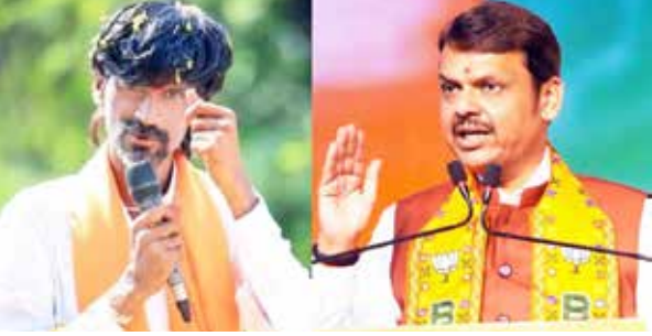
काही देणे घेणे नाही, परंतु मराठ्यांची एकजूट सरकारचा घाम फोडणारी आहे, कोणीही आले तरी आमहाला सुख नव्हते, आमहाला संघर्ष करावाच लागणार आहे. कोणीही मुख्यमंत्री झाले तरी आरक्षण घेणार,

मुंबई (कट्टसत्य वृत्त): - महाराष्ट्राचे काळजीवाहू मुख्यमंत्री एकनाथ शिंदे यांची पत्रकार परिषद पार पडली. या पत्रकार परिषदेमध्ये बोलताना पंतप्रधान नरेंद्र मोदी आणि केंद्रीय गृहमंत्री अमित शाह मुख्यमंत्रिपदाबाबत जो निर्णय घेतिला तो आपल्याला मान्य असेल असे एकनाथ शिंदे यांनी म्हटलं आहे. एकनाथ शिंदे यांच्या या भूमिकेनंतर आता देवेंद्र फडणवीस यांच्या मुख्यमंत्रिपदाचा मार्ग मोकळा झाल्याचं बोललं जात आहे. यावर