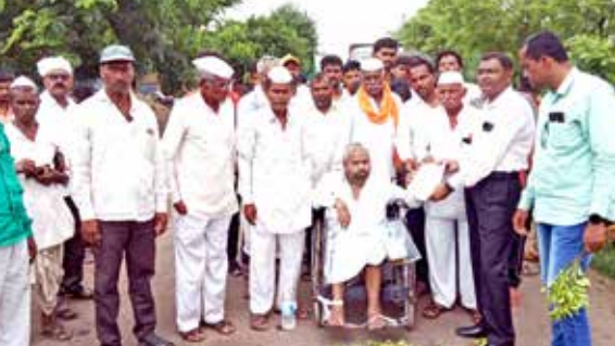
व द्राक्षे बागेला काडयांना मुळ्या आल्याने फळ धारणा होत नाही आल्या आहेत, द्राक्षे बागेला मुळ्या व सर्वच पिकांचे नुकसान झाले

मनोज जरांगे हे प्रमाणिक आंदोलक आहेत, मात्र तरीही राज ठाकरे त्यांच्यावर टीका करतात, राज ठाकरेंनी मराठा आरक्षणाला पाठिंबा दिला नाही, त्यामुळे त्यांचा विरोध आणि निषेध करण्यासाठी प्रयत्न केल्याची प्रतिक्रिया आंदोलकांनी दिली. दरम्यान उद्या देखील दिवसभर राज ठाकरे नांदेडमध्ये आहेत, त्यामुळे पोलिसांनी बंदोबस्त वाढवला आहे.